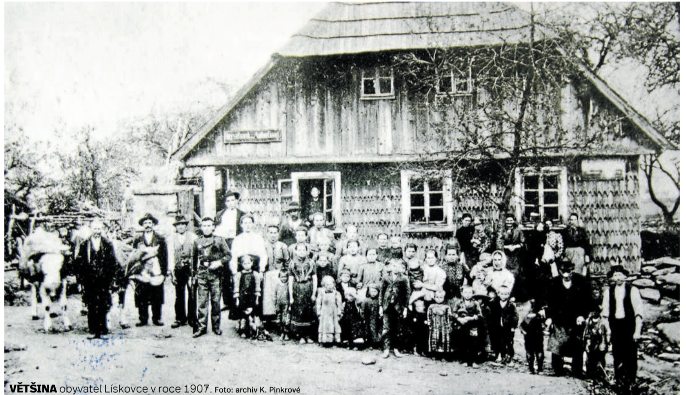
VĚTŠINA obyvatel Lískovce v roce 1907.